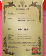
◀筆っこ式ひらがなの教科書(特許取得済)